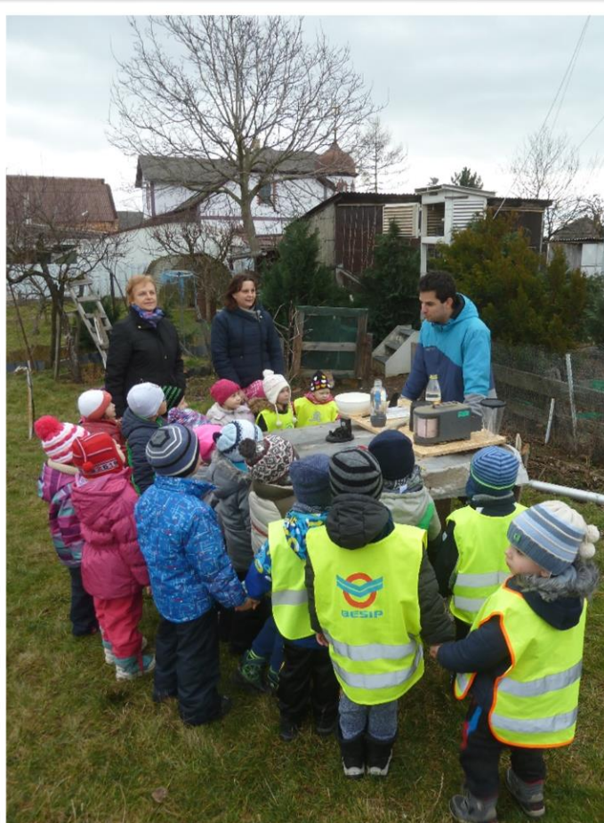
Společné pečení perníčků, návštěva meteostanice...