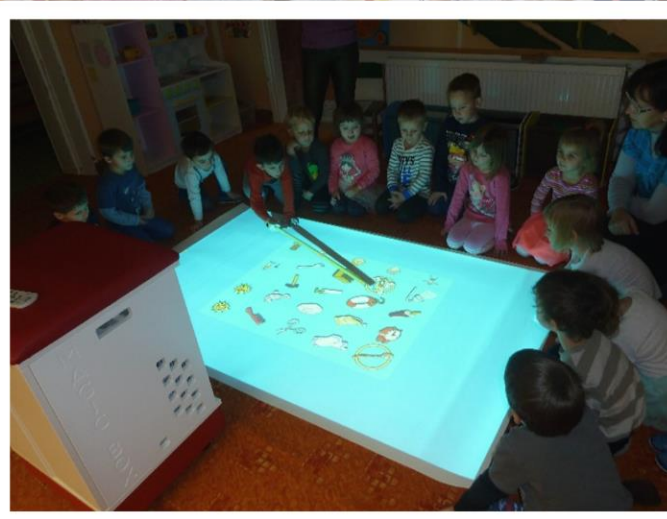
... návštěva u hasičů, sportovní hala, lesní pedagogika, sauna, Magic box...